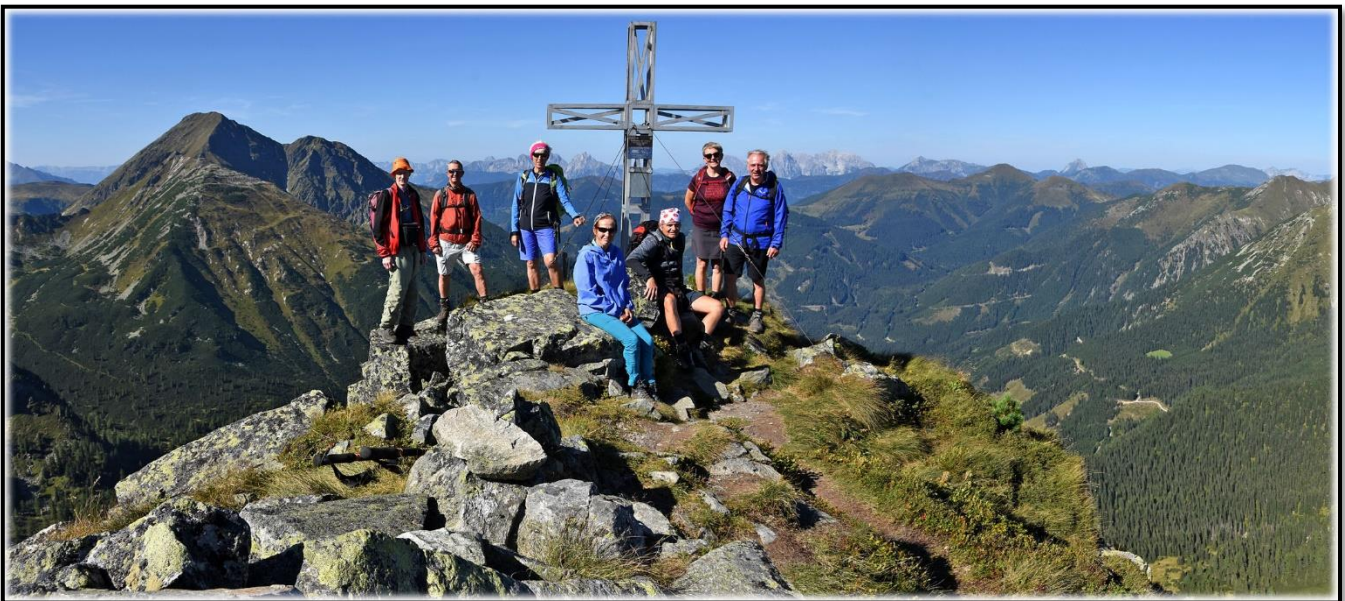
In den Triebener Tauern am Mödringkogel 2142m

Bei Touren mit dem PKW ist meistens genügend Platz für Mitfahrer vorhanden PKW Fahrer bitte rechtzeitig anmelden damit der Organisator der Tour weiß wieviele Plätze zur Verfügung stehen !