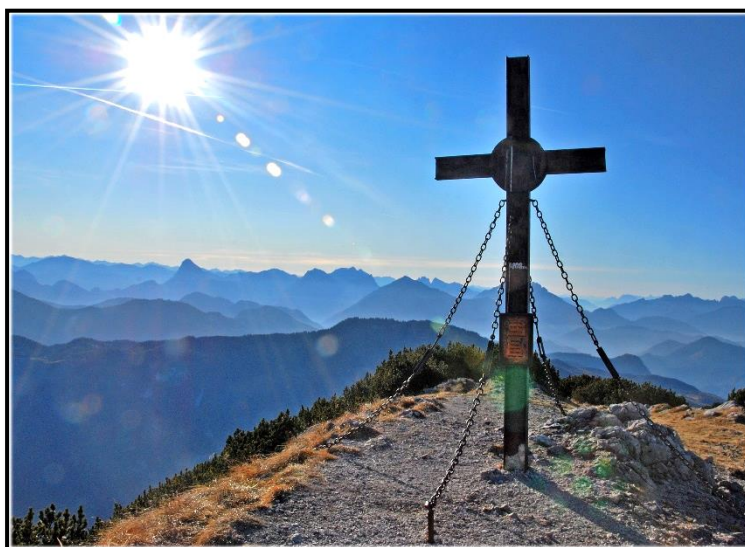
Gipfelkreuz am Hochkar 1808m

Abfahrt um 7 Uhr mit PKW von der Park & Ride Anlage / Mariazellerstraße nach Palfau / Fachwerk. Von Fachwerk 553m Aufstieg über den Noten zum Geischlägerhaus 1769 und zum Gipfel vom Hochkar 1808m. (Hervorragender Aussichtspunkt). Abstieg über Scheineck, Schottenschlag und den Wassergraben zum Moosbauer bei Lassing. Anmeldung und Auskunft bei Sepp Hell , Tel. 0660 / 5581220 oder 0680 / 5565295